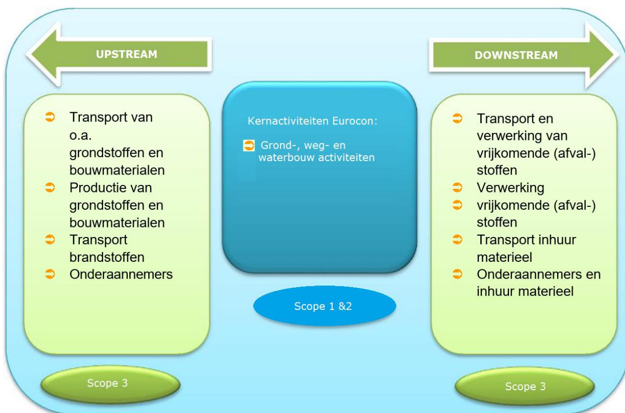
Figuur 2: schematische weergave van de waardeketen

In de upstream keten/activiteiten zijn de belangrijkste ketenpartners te bepalen door een onderzoek naar de inkoopwaarde van de leveranciers. Dat geeft een reëel beeld van de grootste(A)- leveranciers. De belangrijkste upstream ketenpartners zijn leveranciers en producenten, onderaannemers en inhuur materieel. Voor de downstream activiteiten zijn dit transporteurs, maar ook het inhuur van materieel.